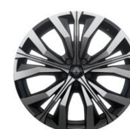
platišča iz lahke litine 51 cm (20") Effie