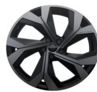
platišča iz lahke litine 51 cm (20") Daytona