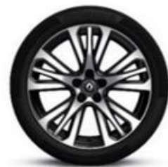
Platišča iz lahke litine 19" Initiale Paris