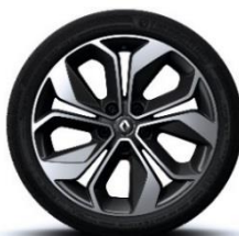
Platišča iz lahke litine 18" Grandtour