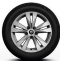
Platišča iz lahke litine 17" Bayadere