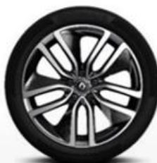
Platišča iz lahke litine 19" Alizarine *