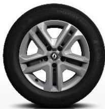
Jeklena platišča Flexwheel 16" z okrasnimi pokrovi Complea

S = Serija O = Opcija - = Ni na voljo * Na voljo v paketu