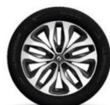
Platišča iz lahke litine 18" Duetto