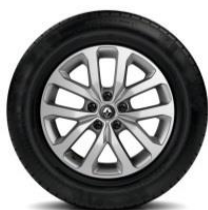
Platišča iz lahke litine 17" Aquilai

S = Serija O = Opcija P = v paketu - = Ni na voljo