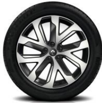
Platišča iz lahke litine 19" Quartz