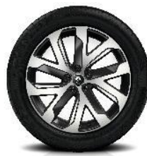
Platišča iz lahke litine 19" Quartz Črna