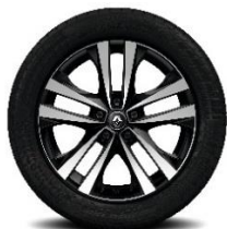
Platišča iz lahke litine 18" Argonaute