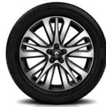
Platišča iz lahke litine 19" Initiale Paris