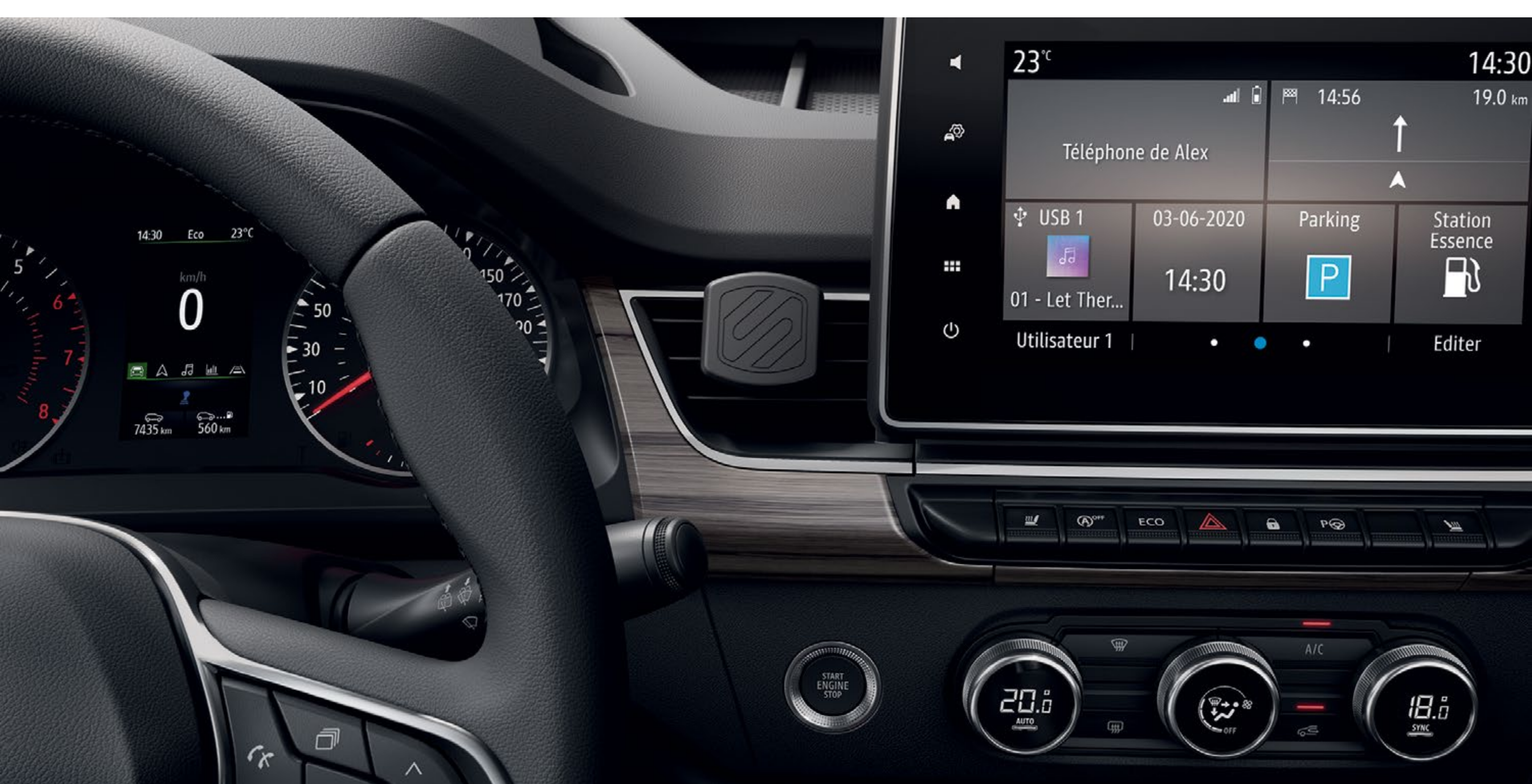
magnetni nosilec za pametni telefon na zračniku (77 11 784 774)

Ostanite povezani z nosilcem za pametni telefon na zračniku, ki se zlije z armaturno ploščo.