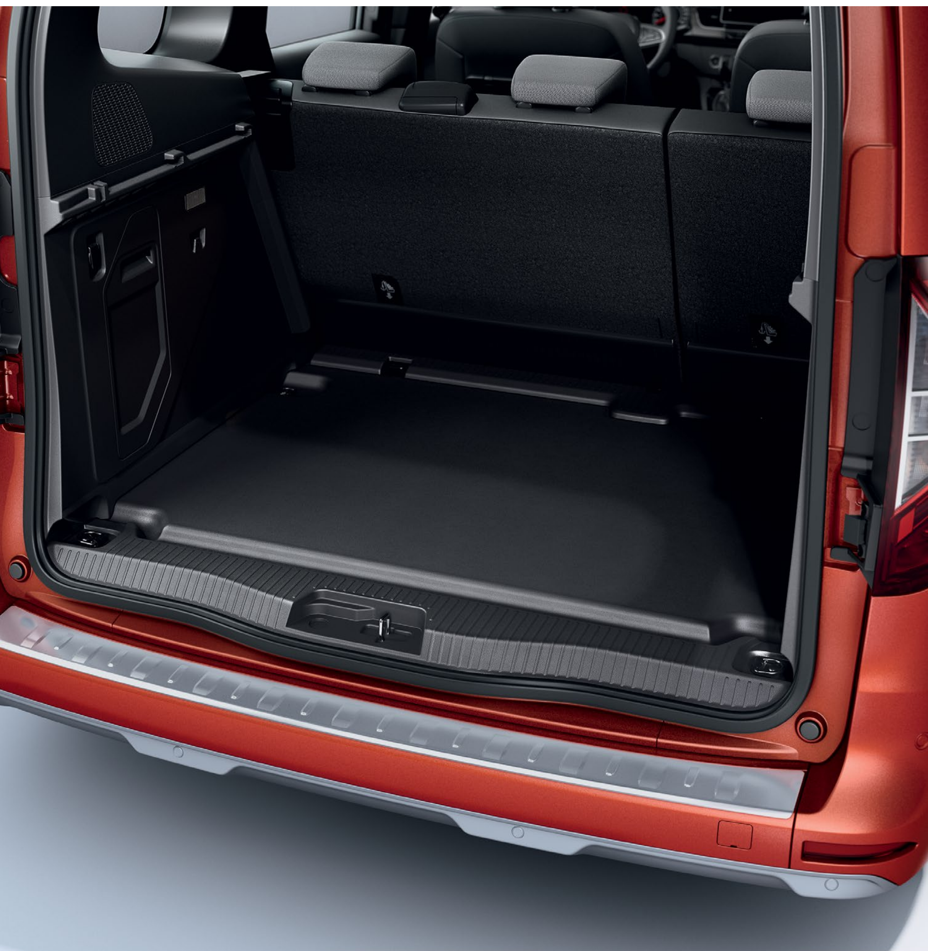
zaščita praga prtljažnika iz nerjavnega jekla (82 01 726 985)

Odkrijte elegantno rešitev za zaščito dostopa do prtljažnika s po meri izdelano zaščito praga iz nerjavnega jekla.