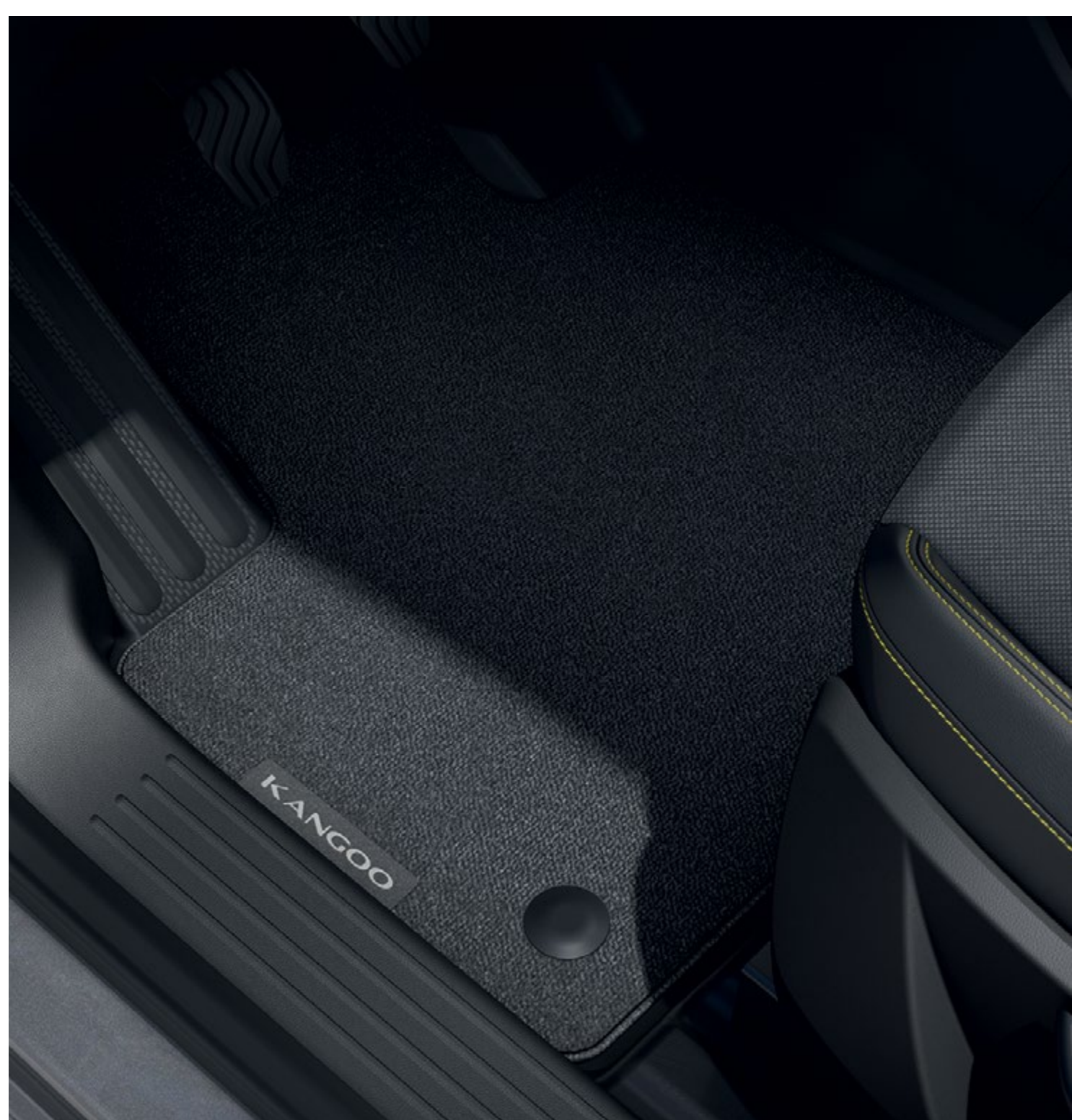
udobne tekstilne preproge – sprednji in zadnji sedeži (82 01 735 431)

Odločite se za našo ponudbo visokokakovostnih preprog. Na mestu so pritrjene s sponkami, zato zagotavljajo udobje, vzdržljivost in vrhunski videz, kar izboljša celoten potniški prostor.