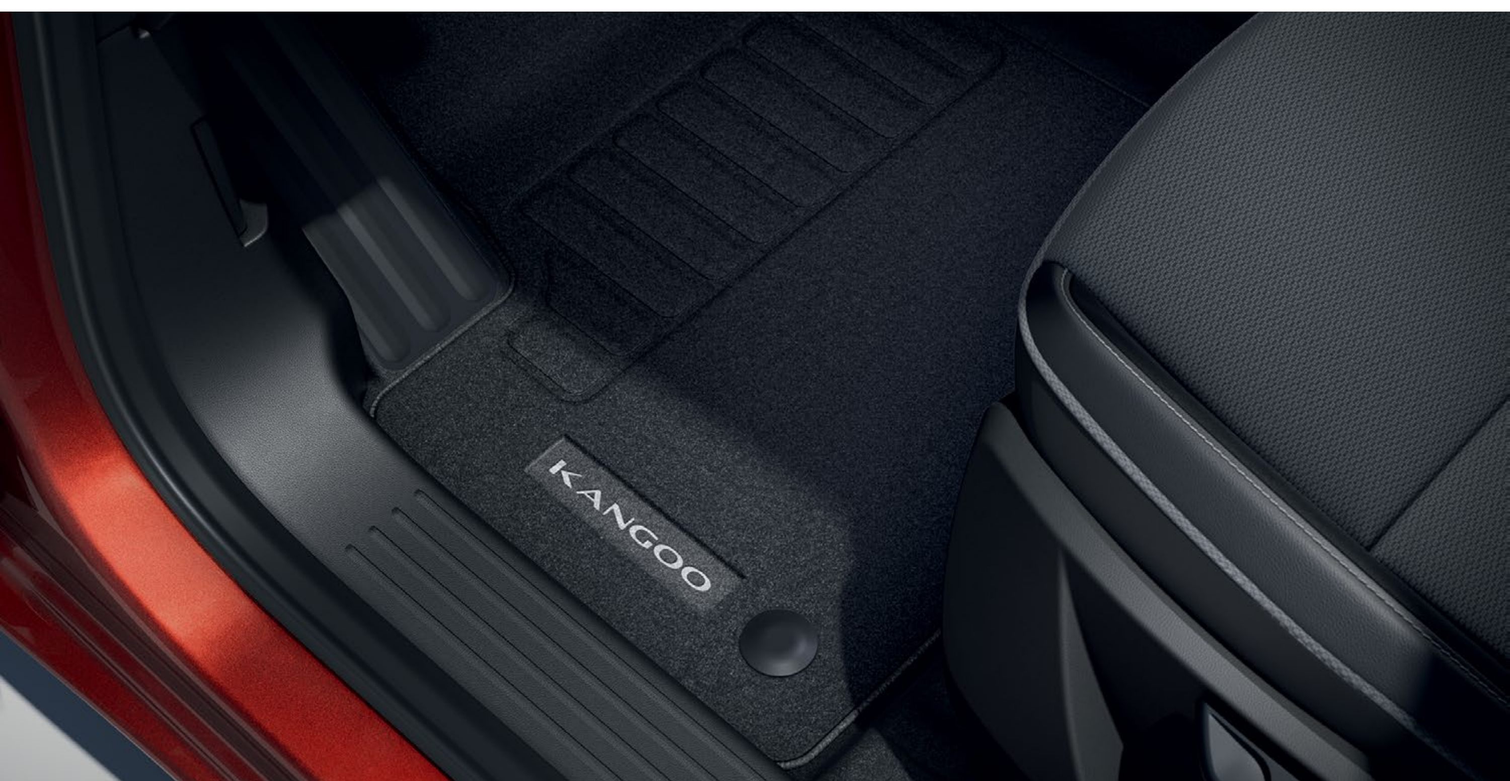
premium tekstilna preproga – prednji in zadnji sedeži (82 01 735 433)