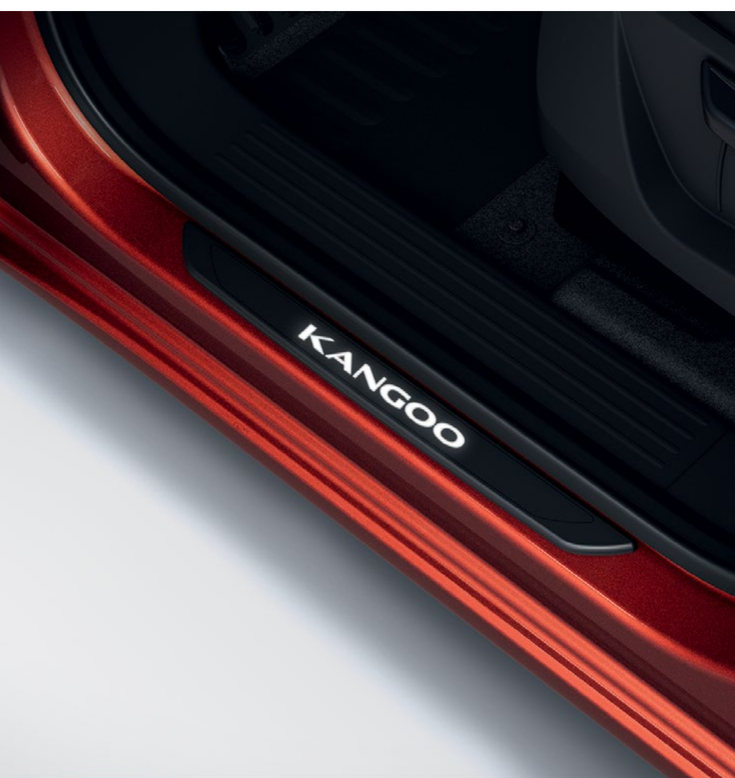
osvetljene obloge pragov vrat (77 11 945 445)

Osvetljene obloge pragov vrat vozila Renault Kangoo podnevi in ponoči dajejo izviren pridih, hkrati pa ščitijo vratne odprtine vozila.