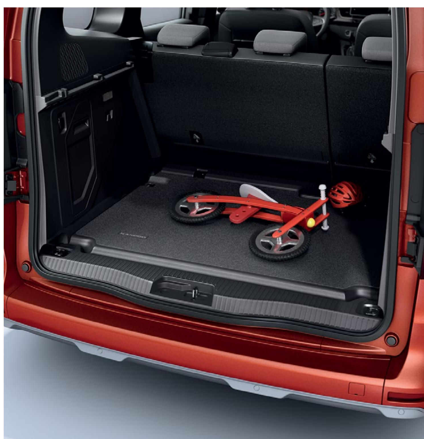
podloga za prtljažnik (82 01 735 435)

Debela in trpežna preproga ščiti originalno oblogo vozila Renault Kangoo.