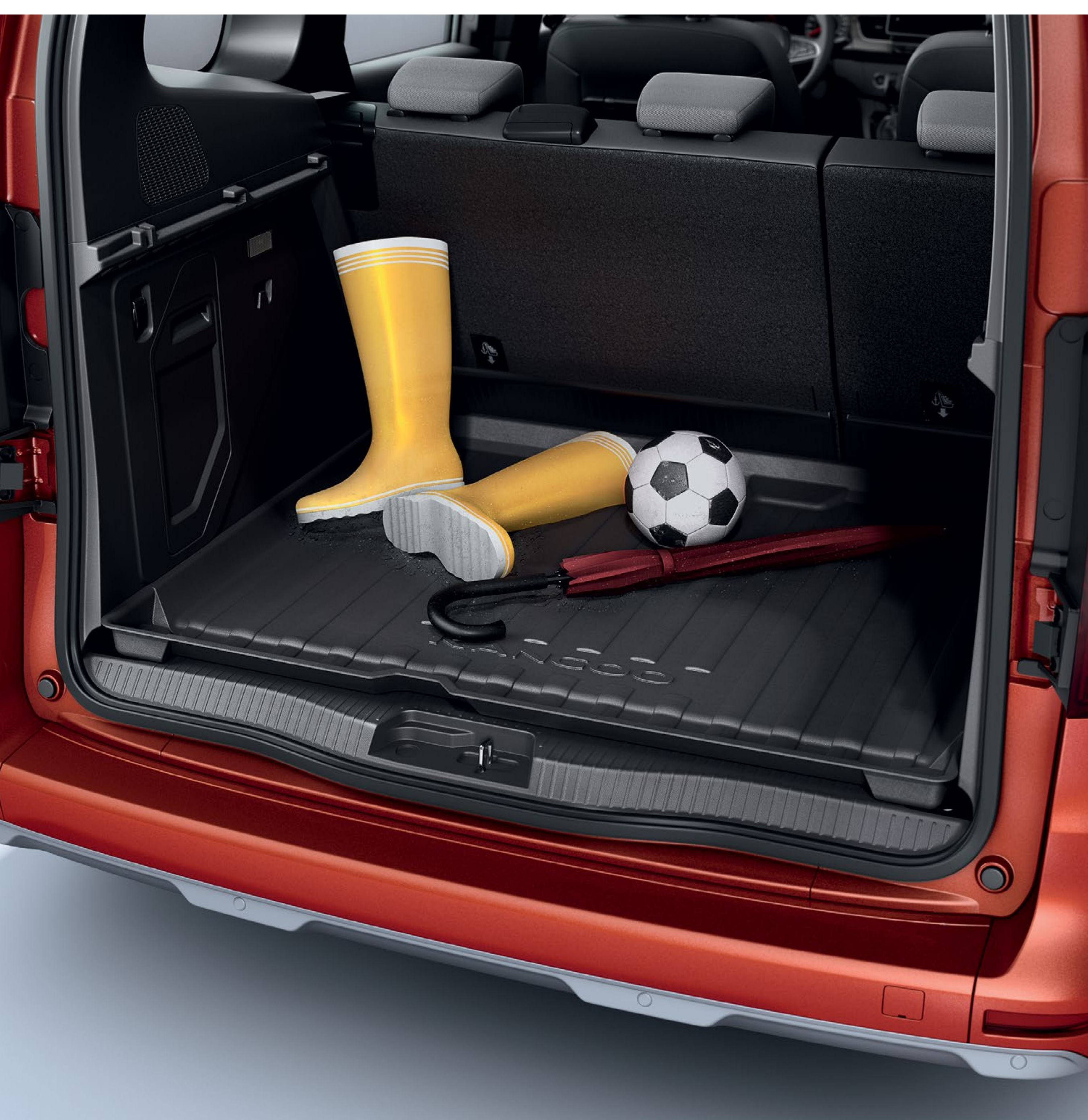
obloga prtljažnika kangoo (82 01 735 902)

Vodoodporna obloga prtljažnika je še posebej primerna za umazane dejavnosti na prostem.