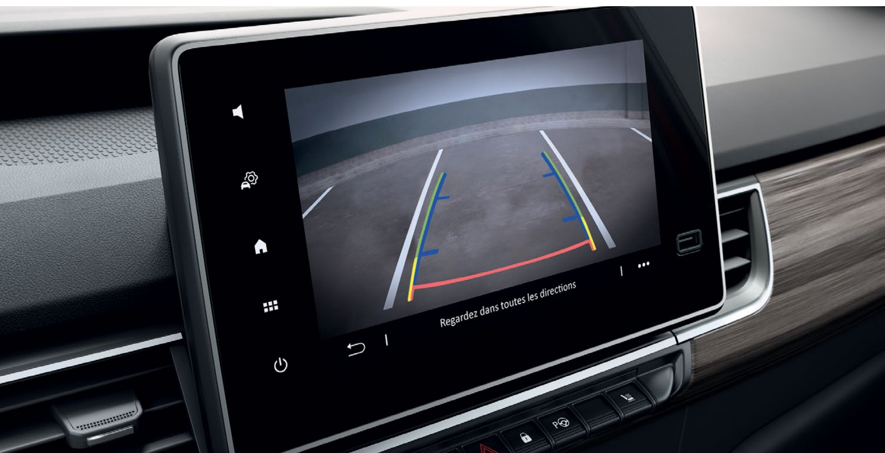
kamera za vzvratno vožnjo (28 44 274 54R)

S kamero za vzvratno vožnjo lahko vidite in se izognete morebitnim oviram za vozilom.