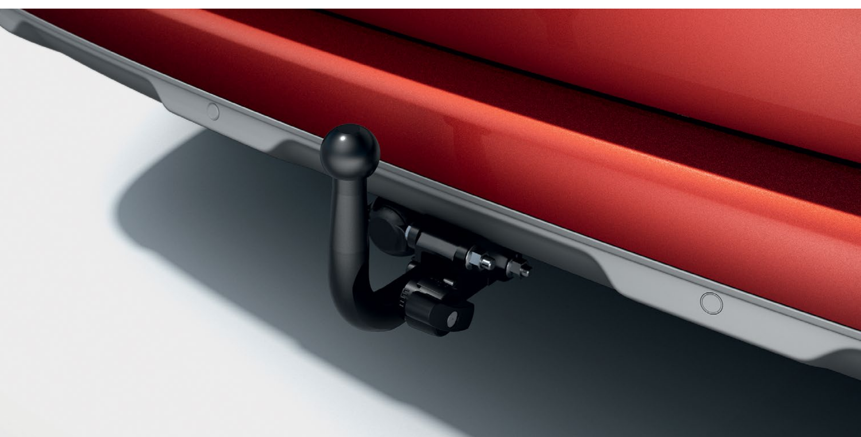
paket s 13-polno prostoročno snemljivo vlečno kljuko (podrobnosti na strani 10)