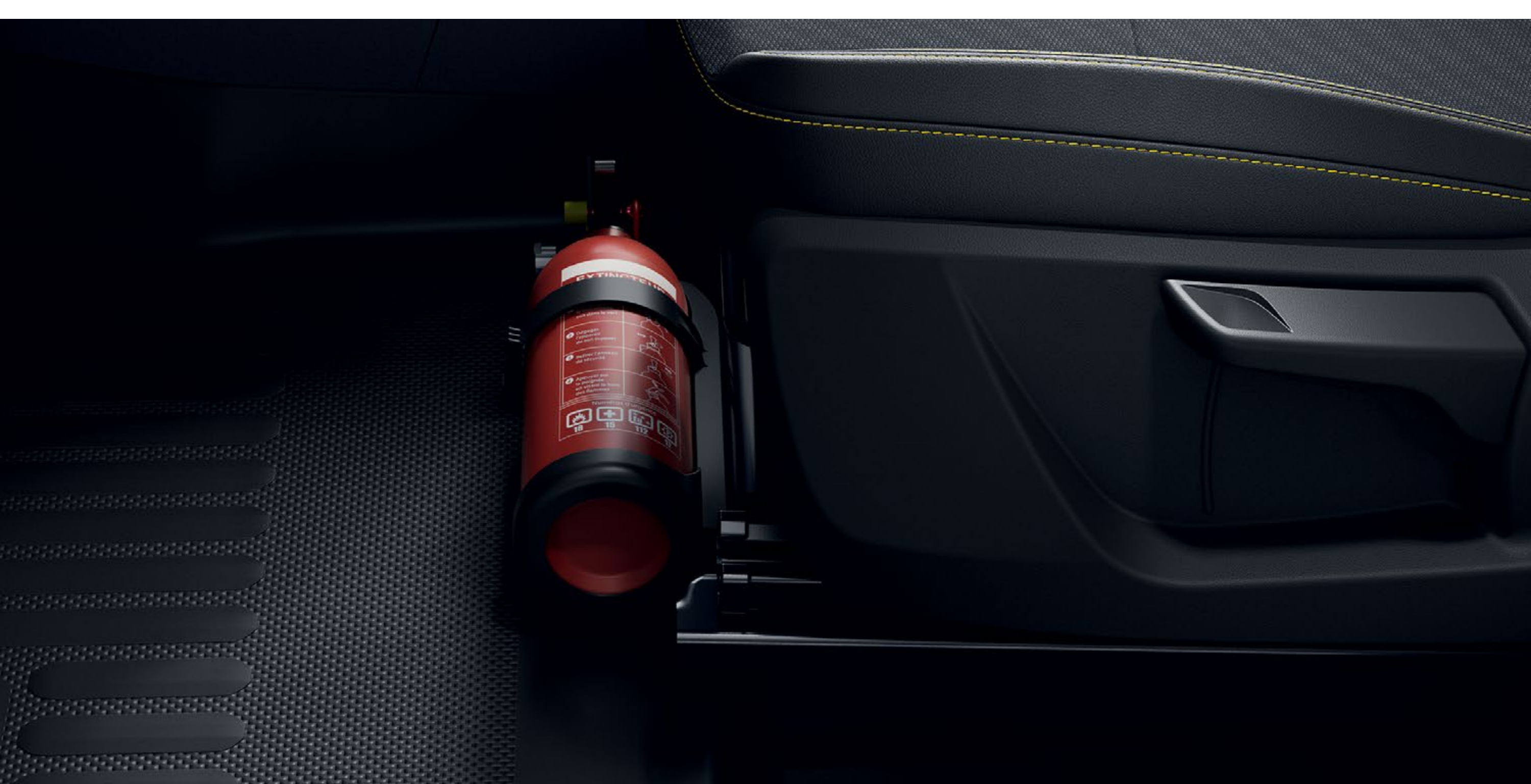
nosilec za gasilni aparat (82 01 734 042)

Za dodatno varnost na vozilu imejte gasilni aparat vedno pri roki zaradi posebnega sistema za pritrditev.