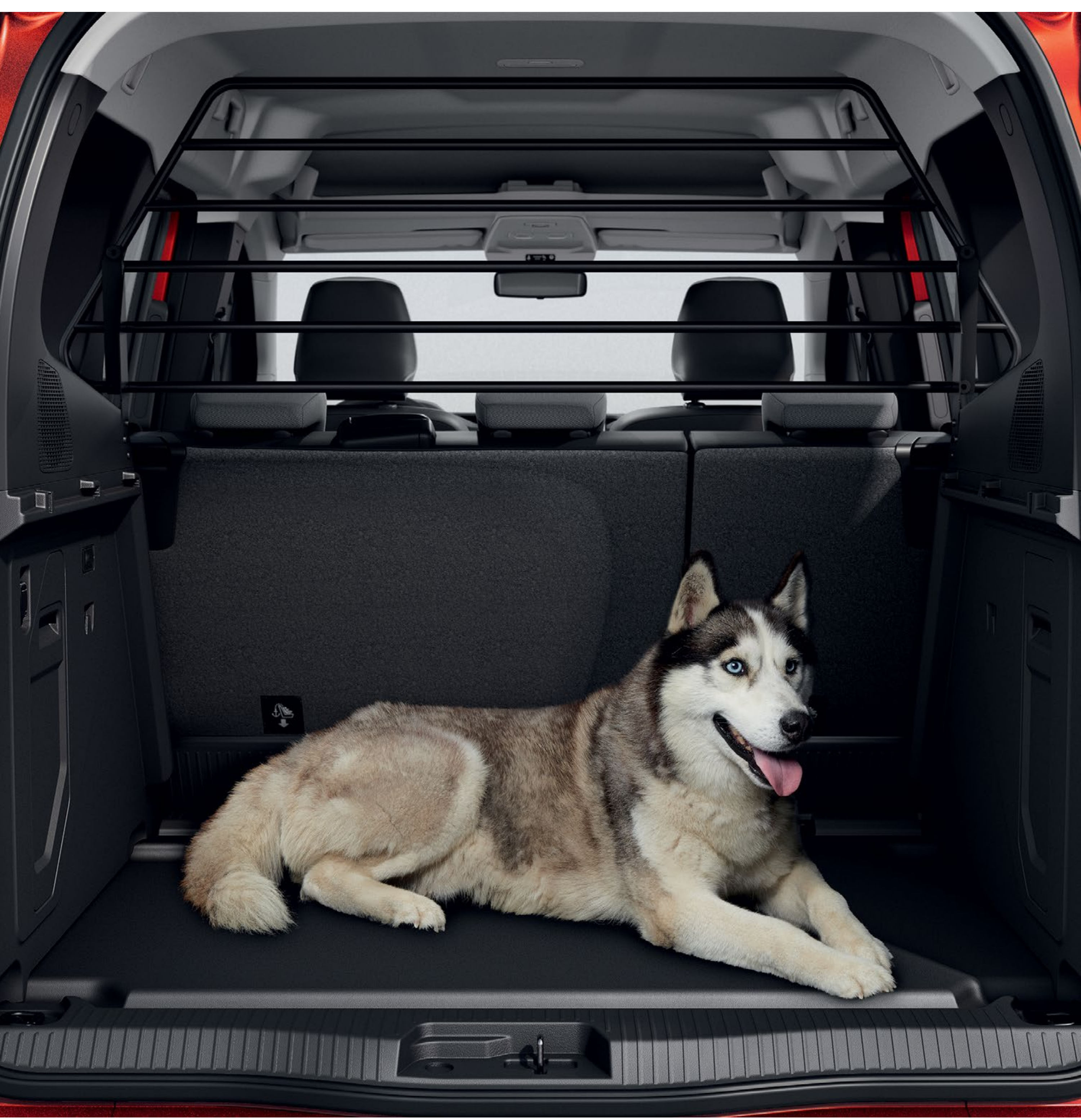
predelna stena (82 01 735 148)

V Renault Kangoo namestite predelno steno med prtljažnikom in potniškim prostorom za varen prevoz hišnega ljubljénčka.