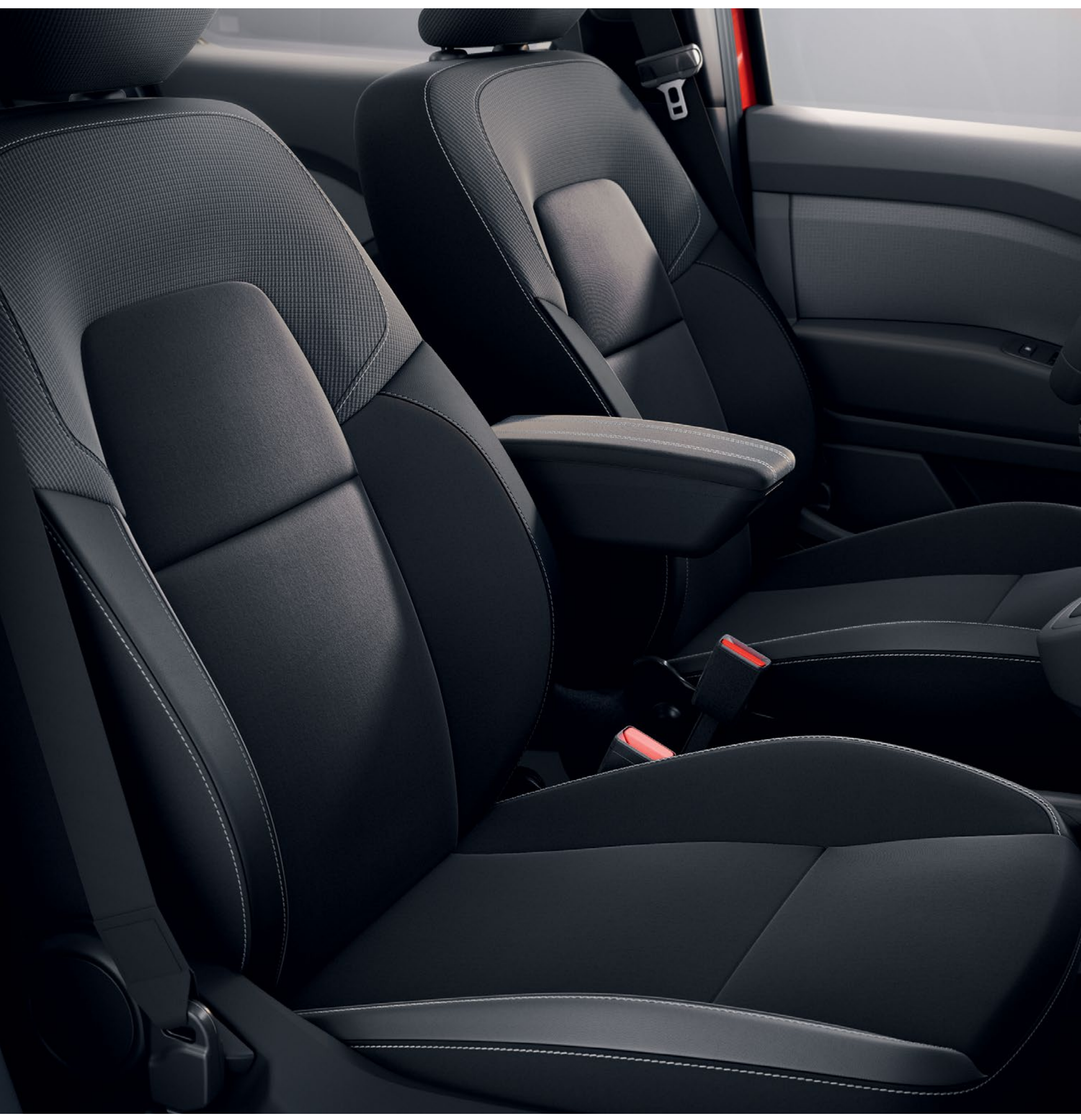
sprednji naslon za roke (87 75 045 04R)

Opremite notranjost svojega vozila Renault Kangoo tako, da mu dodate sprednji naslon za roke.