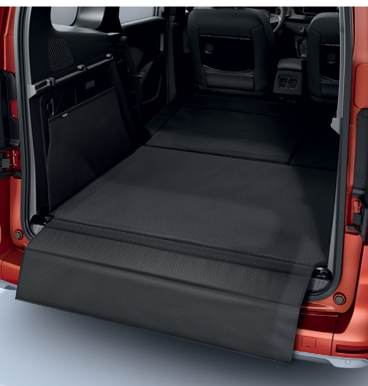
prilagodljiva zaščita prtljažnika Easyflex (82 01 735 903)

Ne glede na konfiguracijo vozila zaščita easyflex pokriva celoten prtljažnik in sedežno klop: idealno za prevoz večjih predmetov.