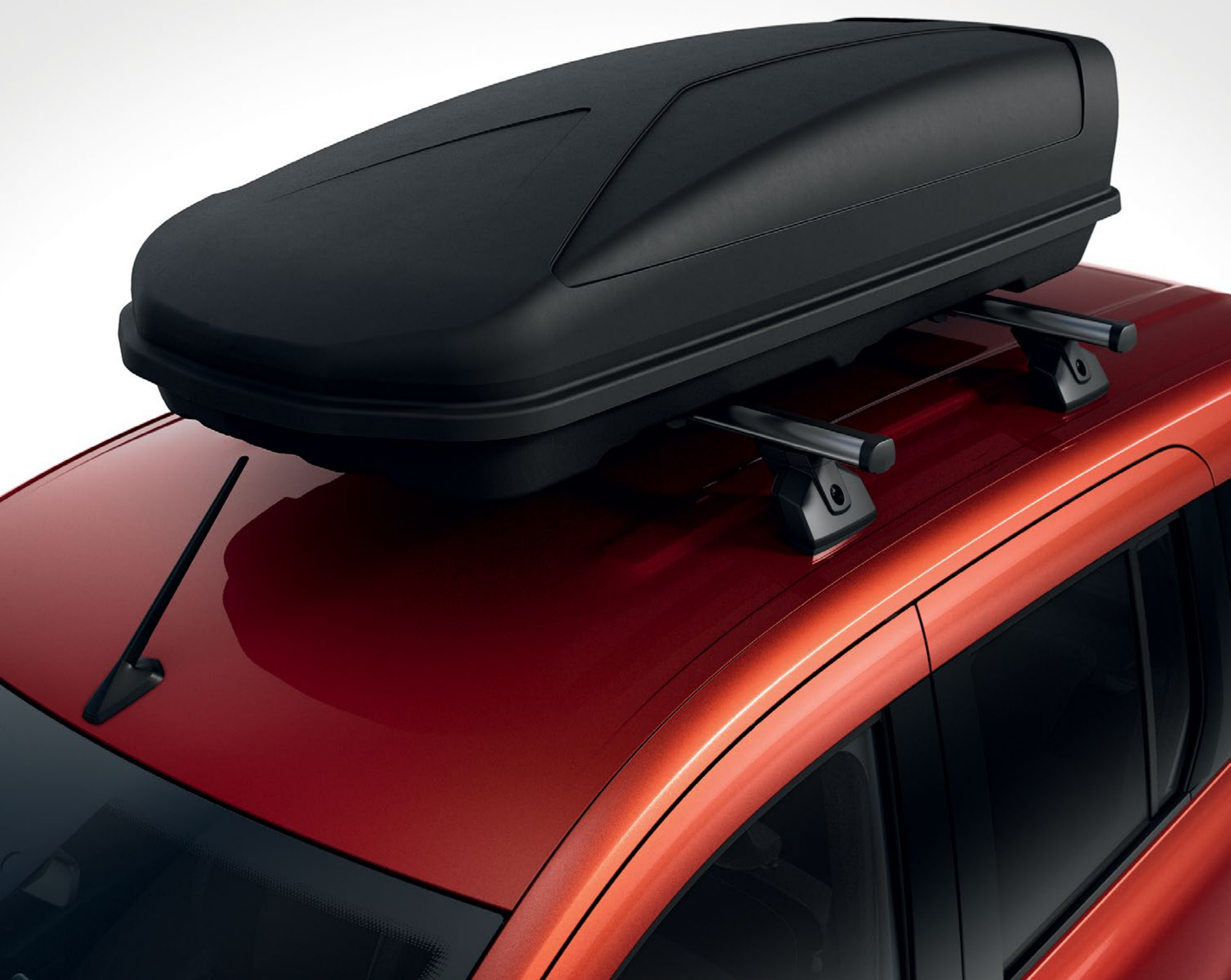
480-litrski trdi strešni kovček (77 11 785 586)

Prečni strešni nosilci, strešni kovčki in fiksne ali brez orodja odstranljive vlečne kljuke uresničijo vašo željo po pobegu.