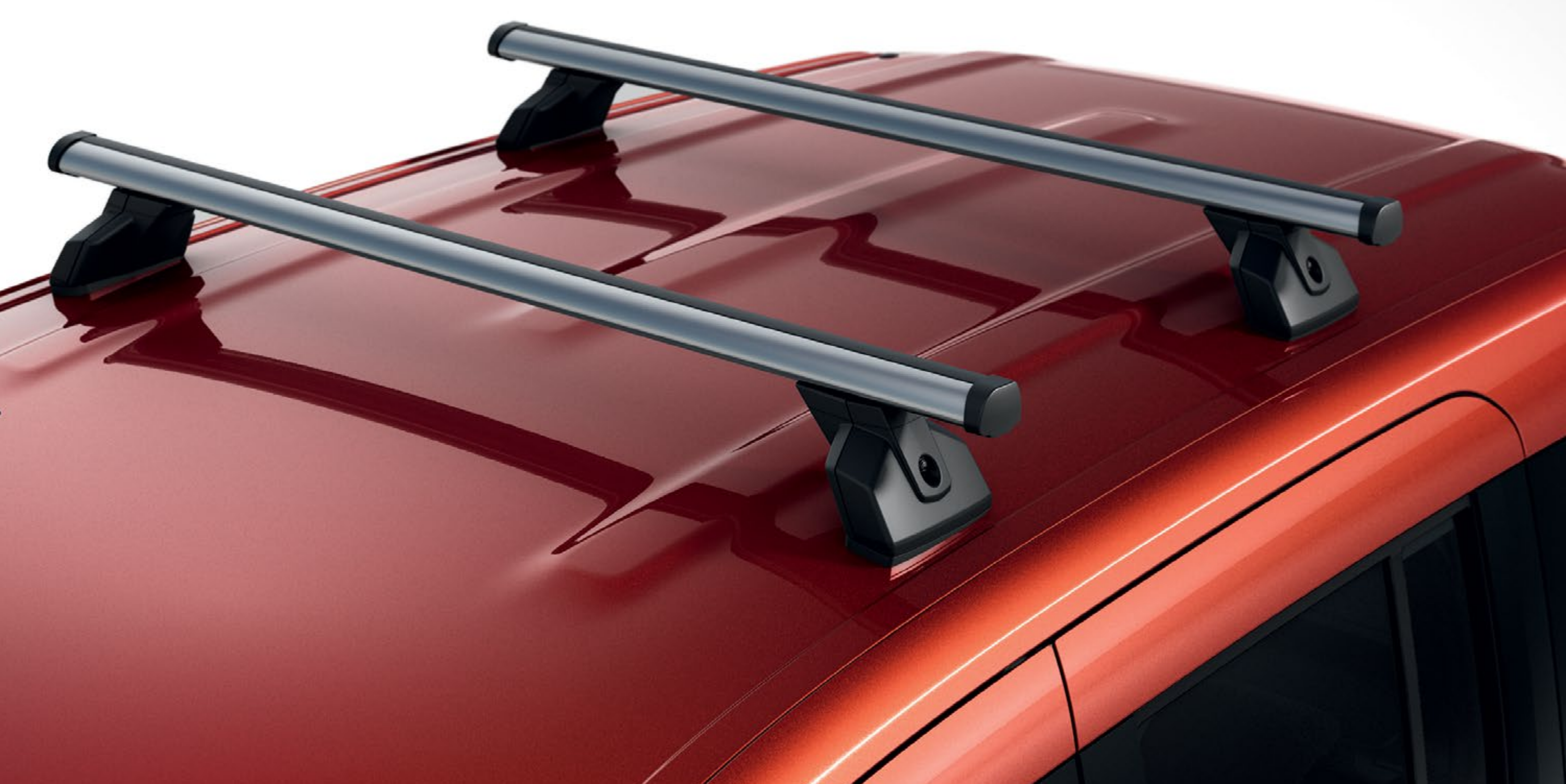
prečni strešni nosilci (82 01 729 142)

Kolesa in smuči varno namestite na streho s strešnimi nosilci Quickfix ter drugo dodatno opremo, namenjeno prevozu prtljage.