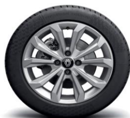
Platišča iz lahke litine 41 cm (16") Boa Vista