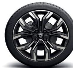
Platišča iz lahke litine 43 cm (17") Monastella