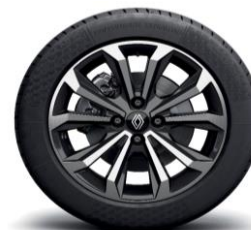
Platišča iz lahke litine 41 cm (16") Boa Vista v črni barvi