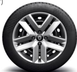
Okrasni pokrovi 41 cm (16") jeklenih platišč Amicitia