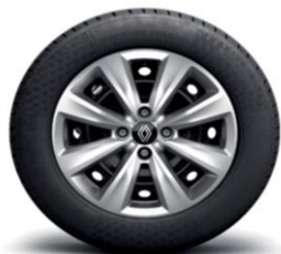
Okrasni pokrovi 38 cm (15") jeklenih platišč Iremia

(1) Obvezno razen ob izbiri barv karoserije TEEQB in TENNP