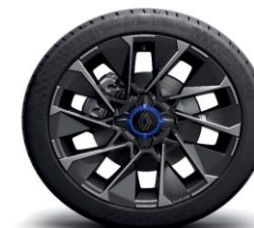
Platišča iz lahke litine 43 cm (17") La Fleche