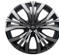
platišča iz lahke litine 51 cm (20") Effie