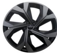
platišča iz lahke litine 51 cm (20") Daytona