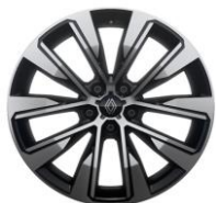
platišča iz lahke litine 48 cm (19") Komah

S = Serijsko O = Opcija P = V paketu - = Ni na voljo