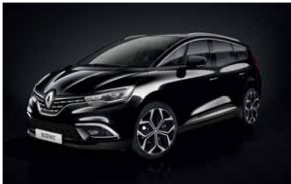
črna Etoile (2)