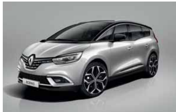
siva Platine (2)