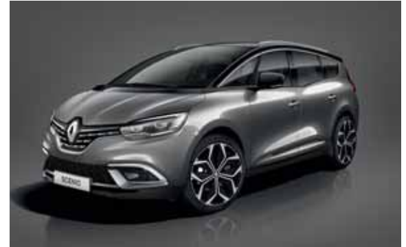
siva Cassiopee (2)