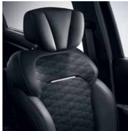
oblazinjenje v črnem usnju Black Edition

* vsi sedeži, ki so omenjeni kot usnjeni, so sestavljeni iz pravega usnja in prevlečenega tekstila. Za vsa vprašanja glede uporabljenih materialov se lahko obrnete na svojega prodajnega svetovalca.