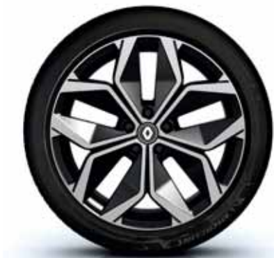
platišča iz lahke litine 51 cm (20") Uraya