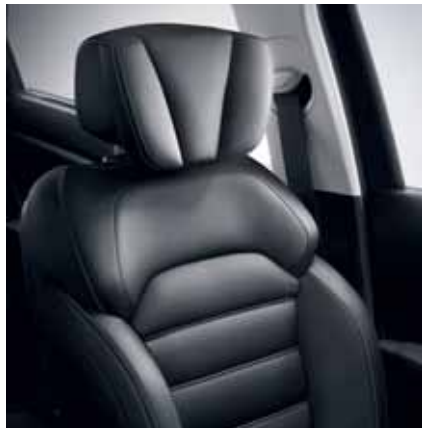
oblazinjenje v črnem** usnju*