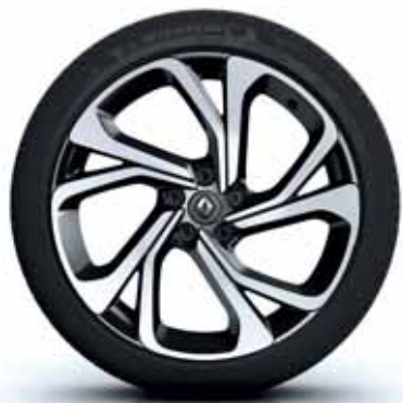
platišča iz lahke litine 51 cm (20") Black Edition