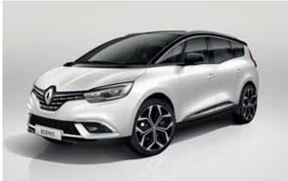
ledeniško Bela (1)