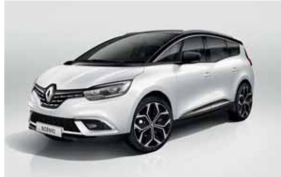
bela Perla (3)