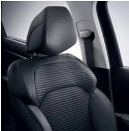
oblazinjenje v temnem blagu v kombinaciji z imitacijo usnja