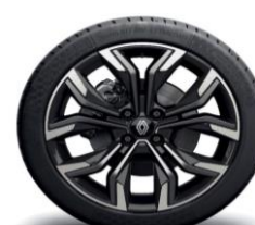
Platišča iz lahke litine 43 cm (17") Monastella