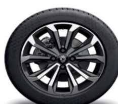
Platišča iz lahke litine 41 cm (16") Boa Vista v črni barvi