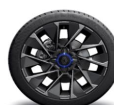
Platišča iz lahke litine 43 cm (17") La Fleche