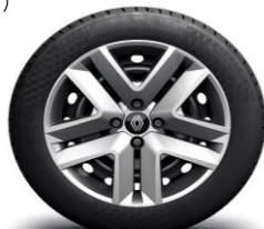
Okrasni pokrovi 41 cm (16") jeklenih platišč Amicitia